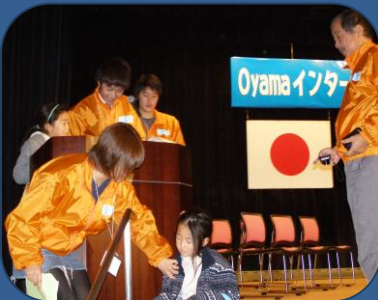
白鷗大学・未来ネットの皆さん