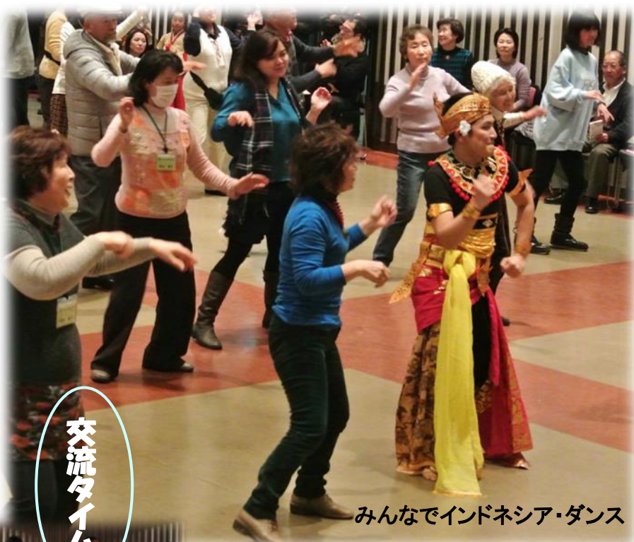
みんなでインドネシア・ダンス