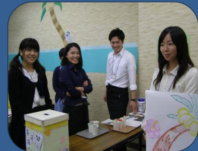
青年国際交流大使の皆さん