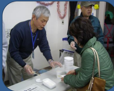
シルバー大学・南校ネットワーク南の皆さん