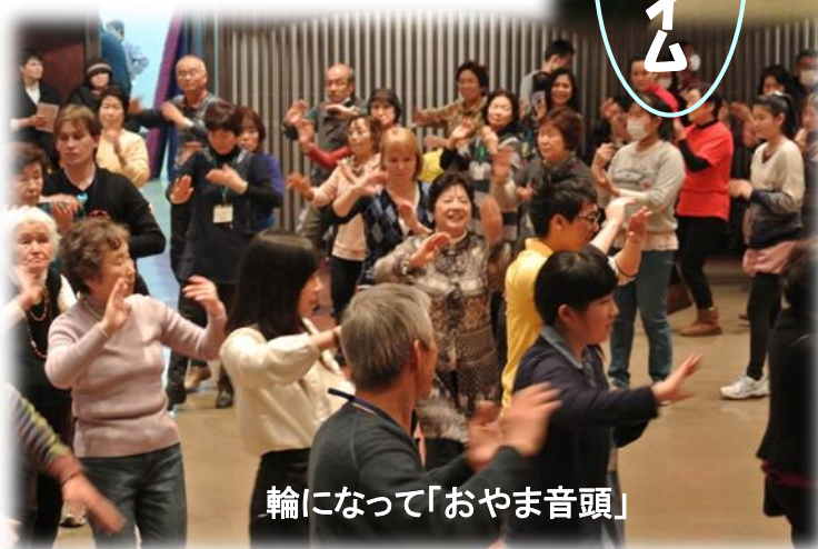
輪になって「おやま音頭」

「おやまインターナショナルフェスティバル 2014」が2月2日（日）、 おやましりつぶんか 小山市立文化センターなどで開催さ れました。昨年同様、白鷗大、シルバ ー大南校などの協 力で活気あふれ るフェスティバルになりました。