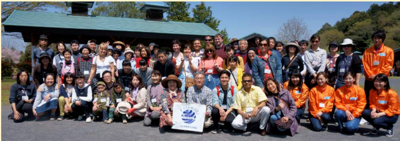
参加者全員で記念写真