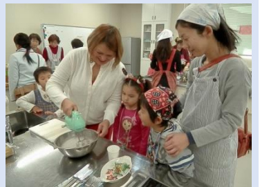
楽しくケーキ作り

ケーキ(ブッシュ・ド・ノエル)デコレートやイギリスのクリスマスクラッカーを経験! さらにハンドベル演奏や、サンタさんからプレゼントまで。娘と二人でワンコイン500円。異文化を知り異国の方と触れ合うことが出来て、とても楽しく有意義な時間を過ごすことが出来ました。ありがとうございました。 (小松智春)