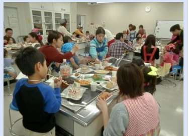
楽しい昼食タイム