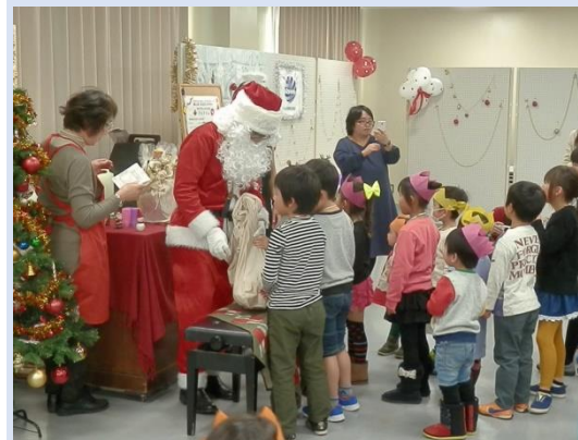
サンタさんからプレゼント