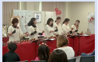
ハンドベルの演奏