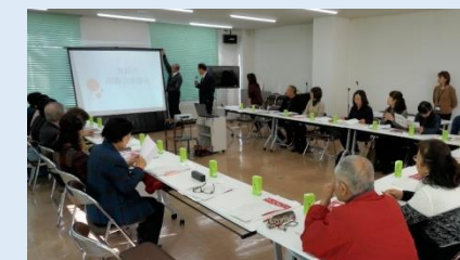
真岡国際交流協会との意見交換