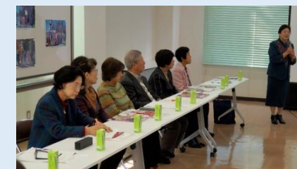
持田副会長から挨拶