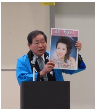
小山市長・協会会長挨拶

2019 年 11 月 10 日（日）10 時から小山市桑市民交流センターマルベリー館にて開催されました。各国の料理やアフリカンビーズアクセサリー販売、よさこいダンス・バンド演奏などのパフォーマンス、着物・民族衣装試着、茶席・座禅・詩吟体験、ワークショップなど、様々な体験をすることが出来ました。その他、展示ブースや大抽選会を楽しみました。