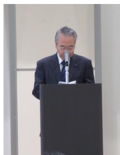
結城市国際交流協会 前場会長挨拶