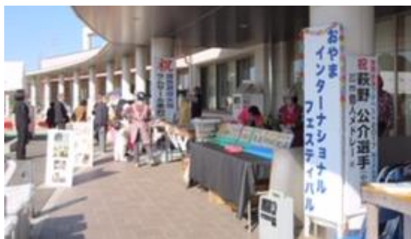
世界の料理販売ブース