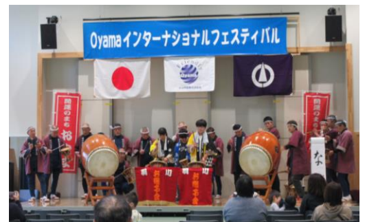
羽川おはやし保存会演奏

来賓の挨拶をいただいた後、羽川お囃子会の和太鼓演奏で盛大に幕開けをしました。小学生と大人、20 数名での演奏は、大変迫力があり、素晴らしいものでした。このあと、このホールでは様々なパフォーマンスが行われました。また、野外ステージでは、よさこいや楽器演奏、世界の料理コーナーが開催されました。