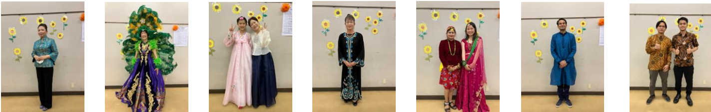
中国 ブラジル 韓国 UAE(ドバイ) ネパール インド インドネシア