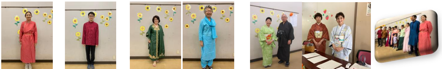
モンゴル マレーシア パキスタン 日本