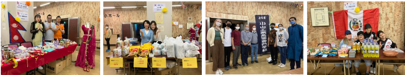
RICH HILLS(ネパール) 順天家(韓国) 小山高専(日本) ラ フロンテラ(ペルー)