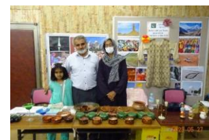
リナ アンド ルナ インター ナショナル (パキスタン)