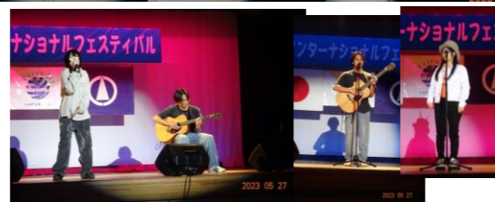
歌、ギター弾き語り Singing, Guitar