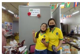
カーザ ブラジル (ブラジル)