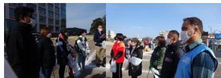
始める前のミーティング