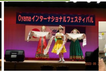
スラブ民族舞踊 Slavic dance