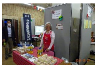
ラ フロンテラ (ペルー)