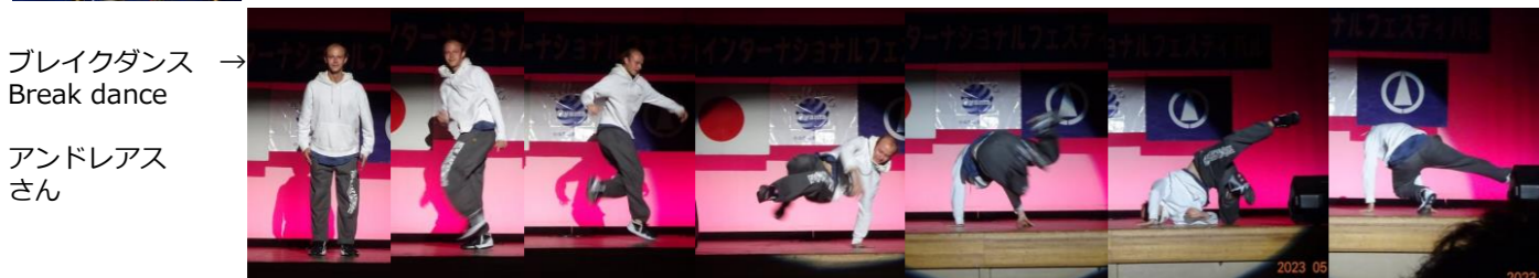
ブレイクダンス → Break dance