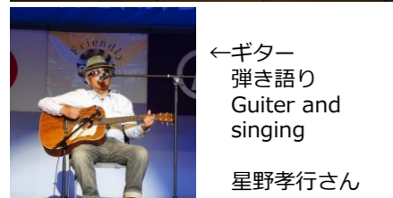
←ギター弾き語り Guitaer and singing