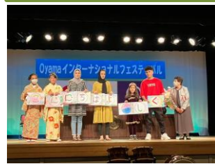
アフガニスタンの子どもたちのあいさつ