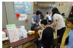
Celebrating Afghan Women's Art and Identity 外国人ふれあい子育てサロン (アフガニスタン)