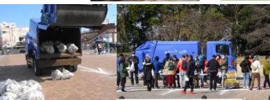
ごみ分別の説明 ごみの投入⇒このボタンを押してください ごみ排出のシーン お疲れ様でした