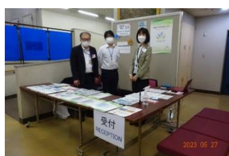
外国人のための無料相談会