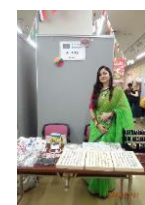
ル・シエル (バングラデシュ)