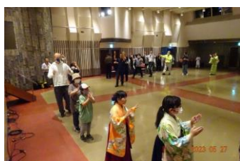
最後はみんなで小山音頭を！

正味3時間ほどのフェスティバルでしたが、盛況のうちに幕を閉じました。7回の実行委員会を開き準備を重ねてきたスタッフの皆さん、前日から応援をいただいたボランティアの皆さん、そして照明、音響等、専門分野で実力を発揮されたTBC学院小山校の皆さんお疲れ様でした。