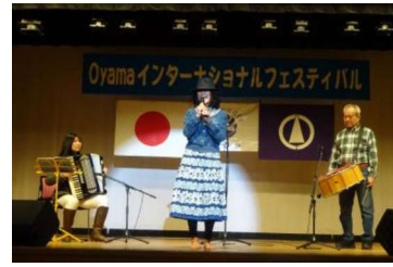
ブラジルのダンス