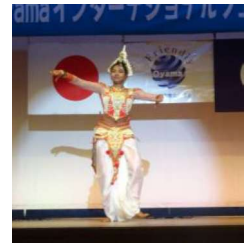
スリランカのダンス