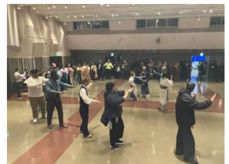
最後は参加者全員で小山音頭を！

ホールの外では各国のブースが立ち並び、物品の紹介、販売が行われました。又、体験コーナーでは琴の演奏やお茶やお菓子を楽しむことが出来ました。展示コーナーでは協会活動の紹介が行われました。体験者の感想は次ページをご覧ください。