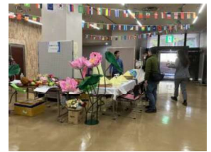
栃木県ベトナム人会