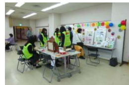
日本語教室コーナー