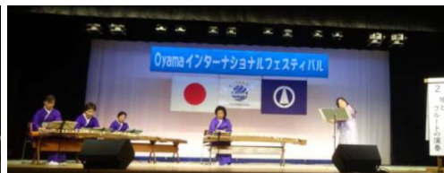
琴とフルートの演奏