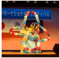
フィリピンのダンス