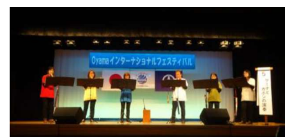
ケーナとカホンの演奏